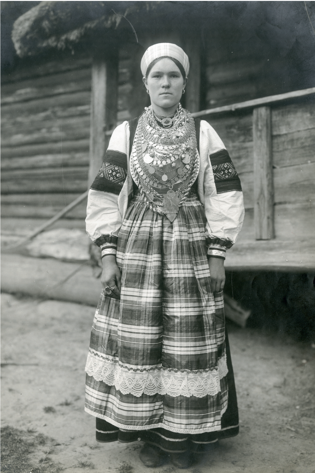
Naine pidulikus riietuses. Pihkva maakond, Pihkva kubermang. Foto: Vassili Mašetškin 1911. REM 2299-8/1