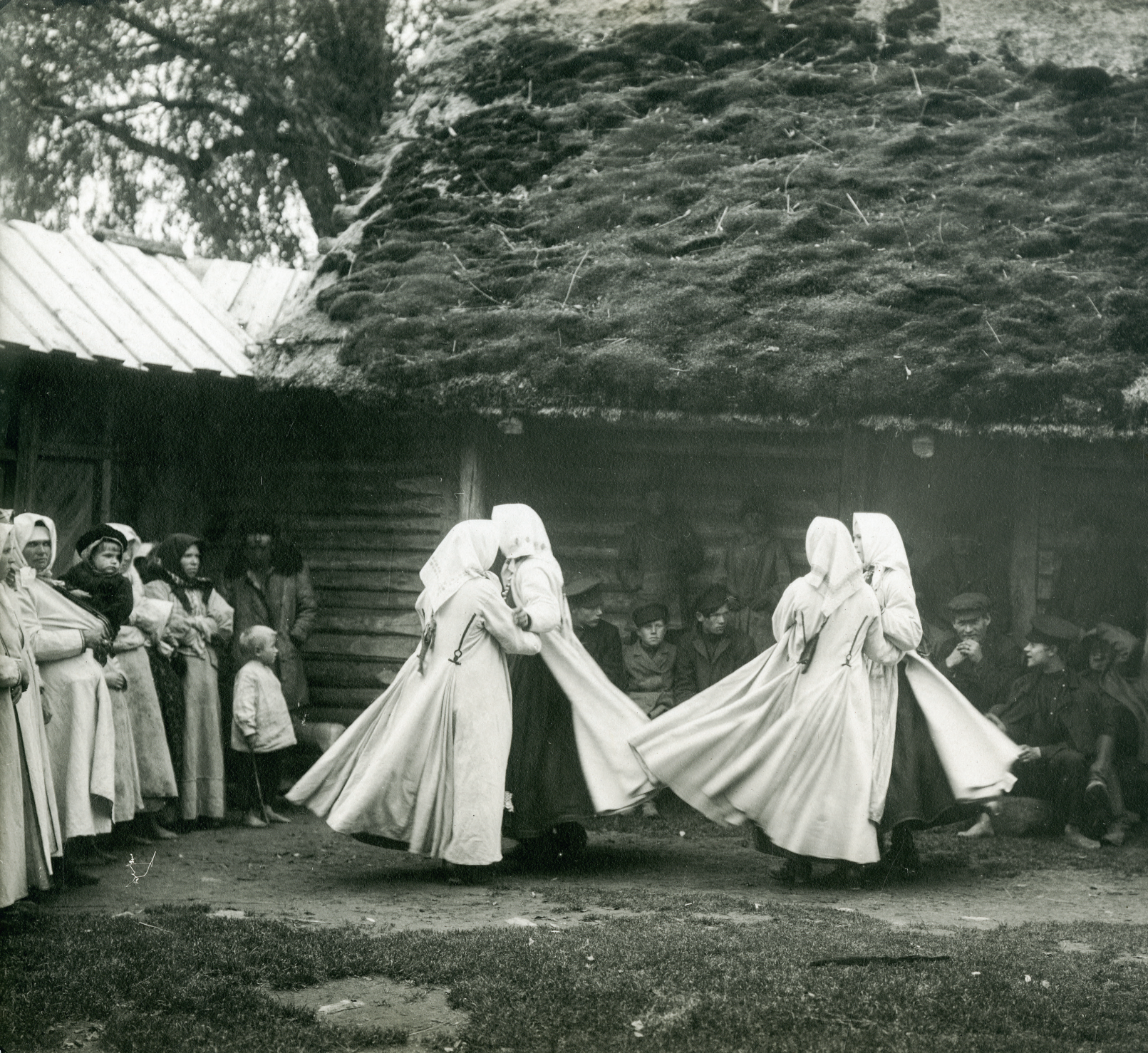
Naised taluõuel tantsimas. Kol'õ (Ignatovo, Gorokhovo), Pihkva maakond, Pihkva kubermang. Foto: Vassili Mašetškin 1911. REM 2298-1/2