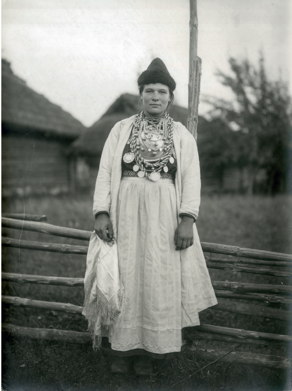
Neiu pruudirõivais. Litvinna (Litvinovo), Pihkva maakond, Pihkva kubermang. Foto: Vassili Mašetškin 1911. REM 2299-19